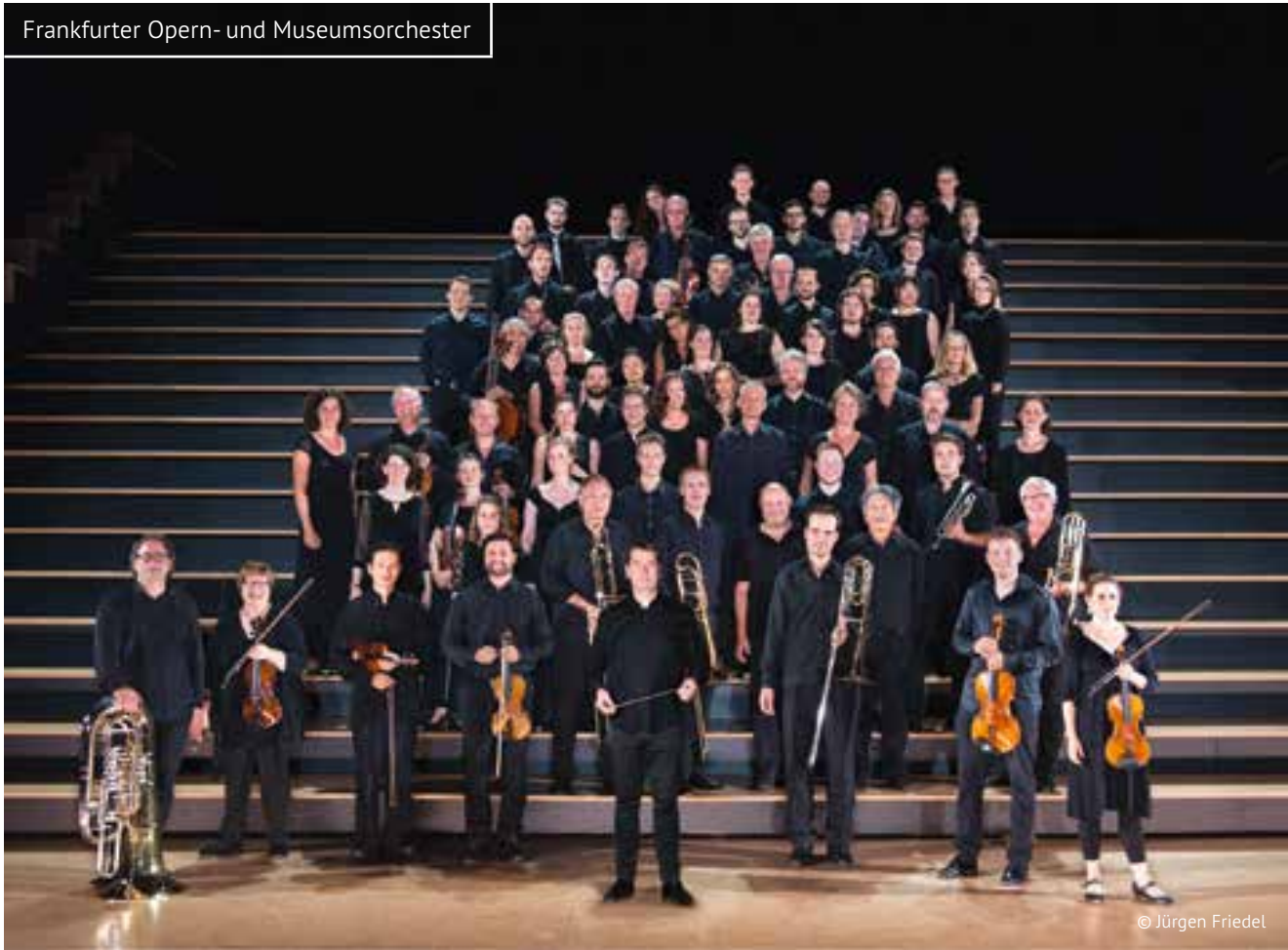
Frankfurter Opern- und Museumsorchester