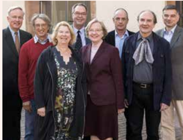
Präsidium des Landesmusikrates Hessen e. V.

Der Musikplan soll Landtagsabgeordneten, Regierungsmitgliedern sowie Kommunalpolitikerinnen und -politikern als Wegweiser durch die Welt der Musikangebote dienen. Er soll anregen, das kulturelle Angebot im jeweiligen gesellschaftlichen Verantwortungsbereich zu festigen und zu erweitern. Zwischen dem Notwendigen, gar dem Wünschenswerten, und dem, was tatsächlich stattfindet, klafft nach wie vor eine große Lücke. Die Bundesrepublik Deutschland hat die Konvention der Vereinten Nationen über den Schutz und die Förderung der Vielfalt kultureller Ausdrucksformen im Jahr 2007 ratifiziert. Dies gilt es jetzt landesweit umzusetzen.