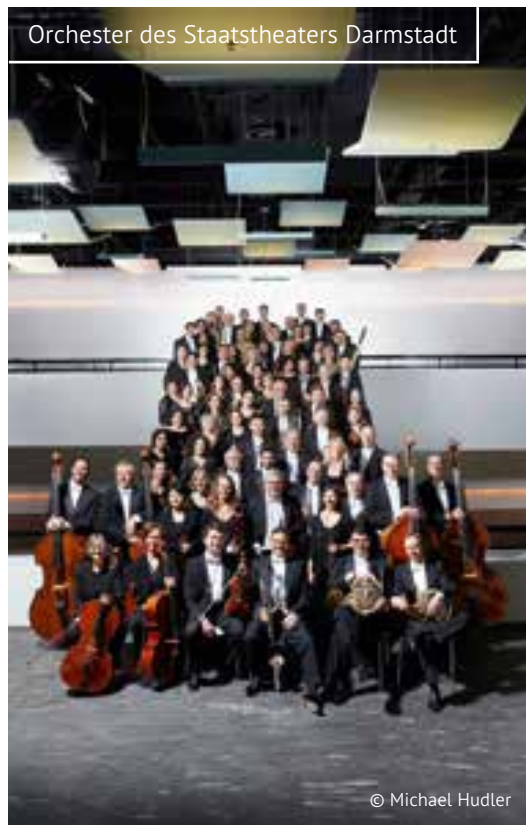
Orchester des Staatstheaters Darmstadt